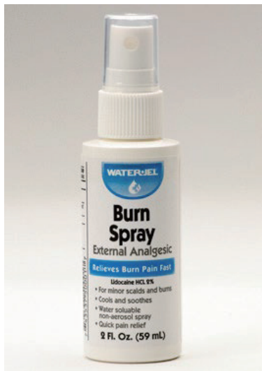
Water-Jel Burn Spray